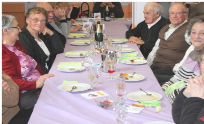
Repas des aînés du 8 février 2015